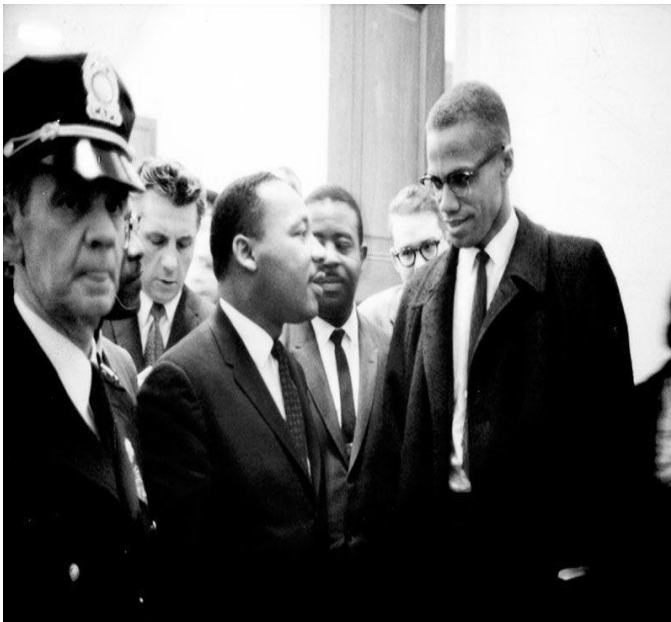
Luther King y Malcolm X

En Estados Unidos la discriminación racial se ha hecho presente en diferentes momentos y te recomendamos checar la guerra civil o de secesión y como esta repercutió para que en lo escrito de hablara de una igualdad, pero no trascendió a los hechos.